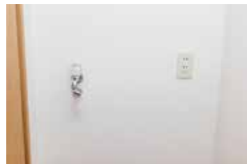
洗面台前に洗濯機置き場