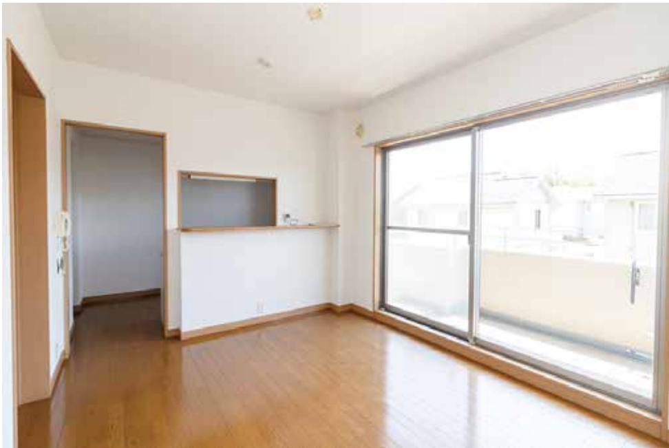
アイランドキッチン カウンター付