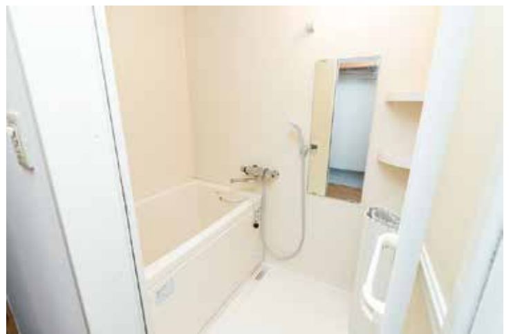
ユニットバス(反転タイプ)